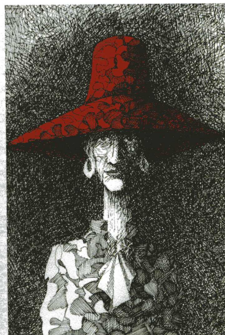
Le Chapeau rouge © Marline Fromageot