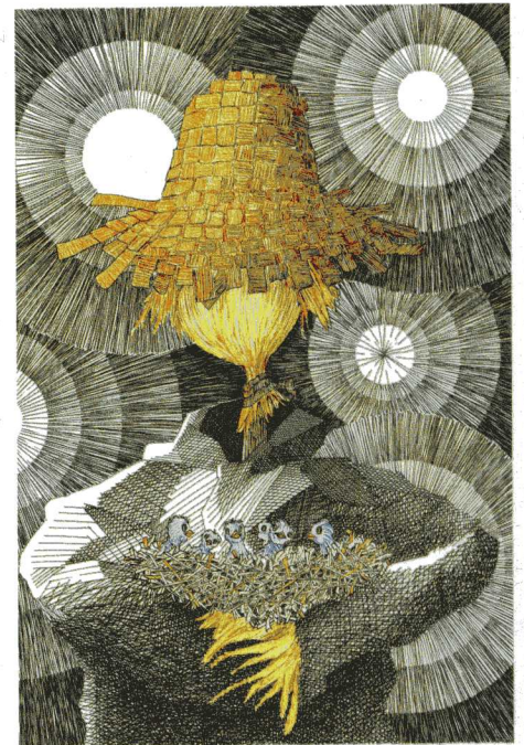
L'Épouvantail sentimental © Marline Fromageot