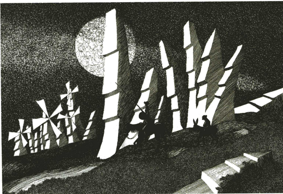
Don Quichotte © Marline Fromageot

« Chacune de ses œuvres, ponctuée de la touche de l'esprit, fait naître le sourire ou l'admiration, et bien souvent les deux mêlés... » Raymond Ménéard