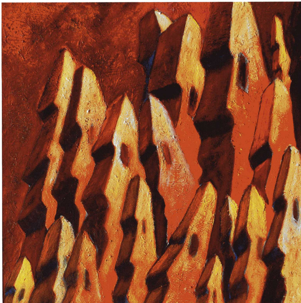
Une cité [détails]