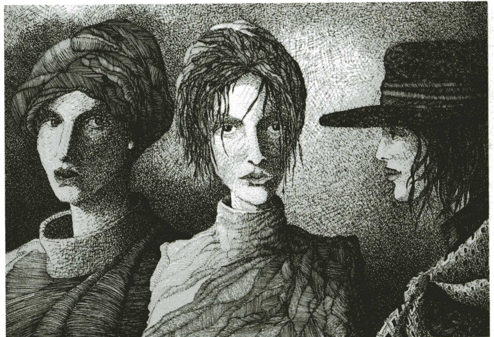
Regards de femmes